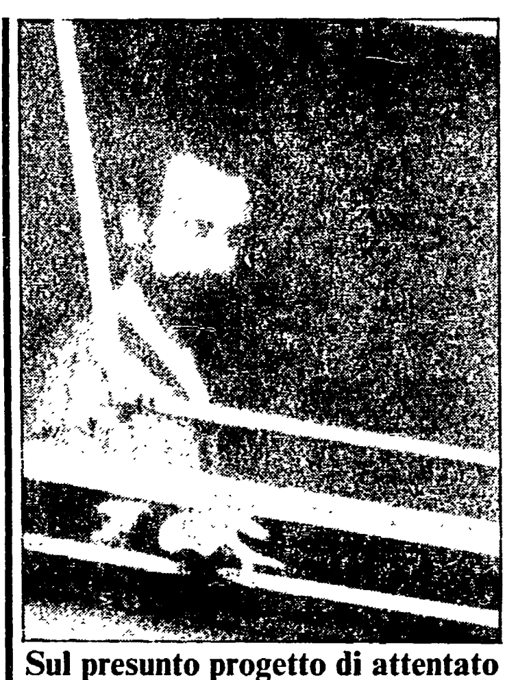
Sul presunto progetto di attentato