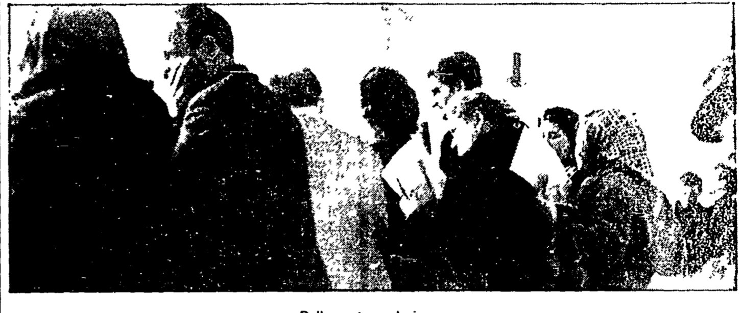
Dalla nostra redazione

Il Comitato di controllo non ha ancora approvato il bilancio '82 - Rischiano di «saltare» importanti forniture sanitarie - Il PCI denuncia la drammatica situazione