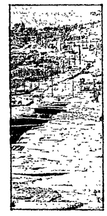
Dalla nostra redazione

Pastore scopre (per caso) zona archeologica. I reperti hanno 4000 anni