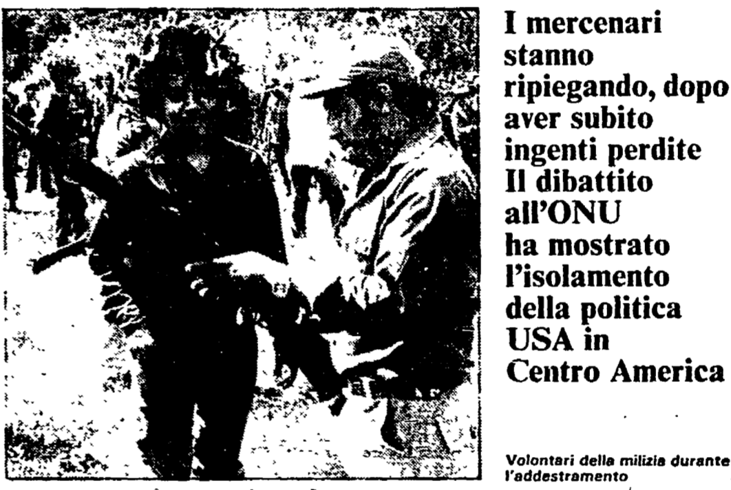
Volontari della milizia durante l'addestramento

Il regime dell'Honduras li abbandona? Il Nicaragua annuncia nuove vittorie