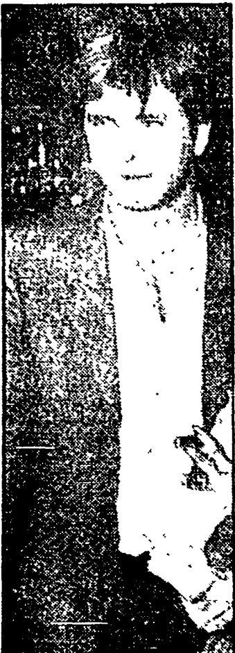
Lovelock: «L'amante dell'Orsa Maggiore» (Rete 1, 20.30)