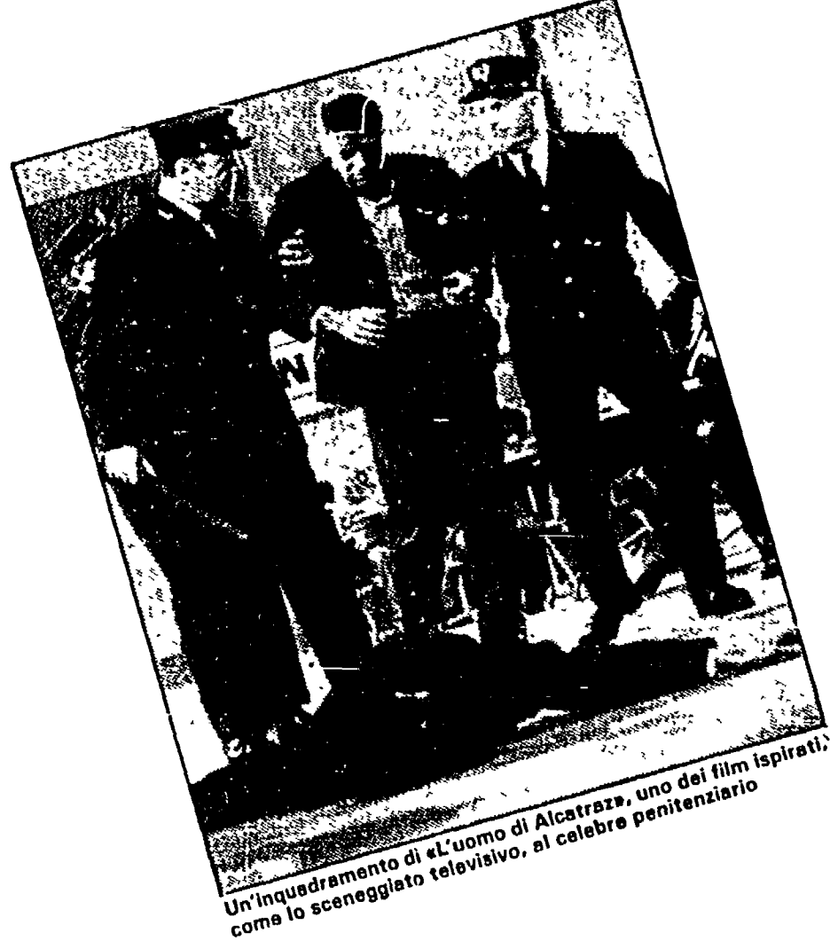
Un'inquadratura di «L'uomo di Alcatraz», uno dei film ispirati come lo sceneggiato televisivo, al celebre penitenziario

Su Canale 5 questa settimana vanno in onda le puntate di «Alcatraz», autobiografia di un «veterano» del famoso penitenziario