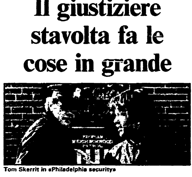
Tom Skerritt in «Philadelphia security»