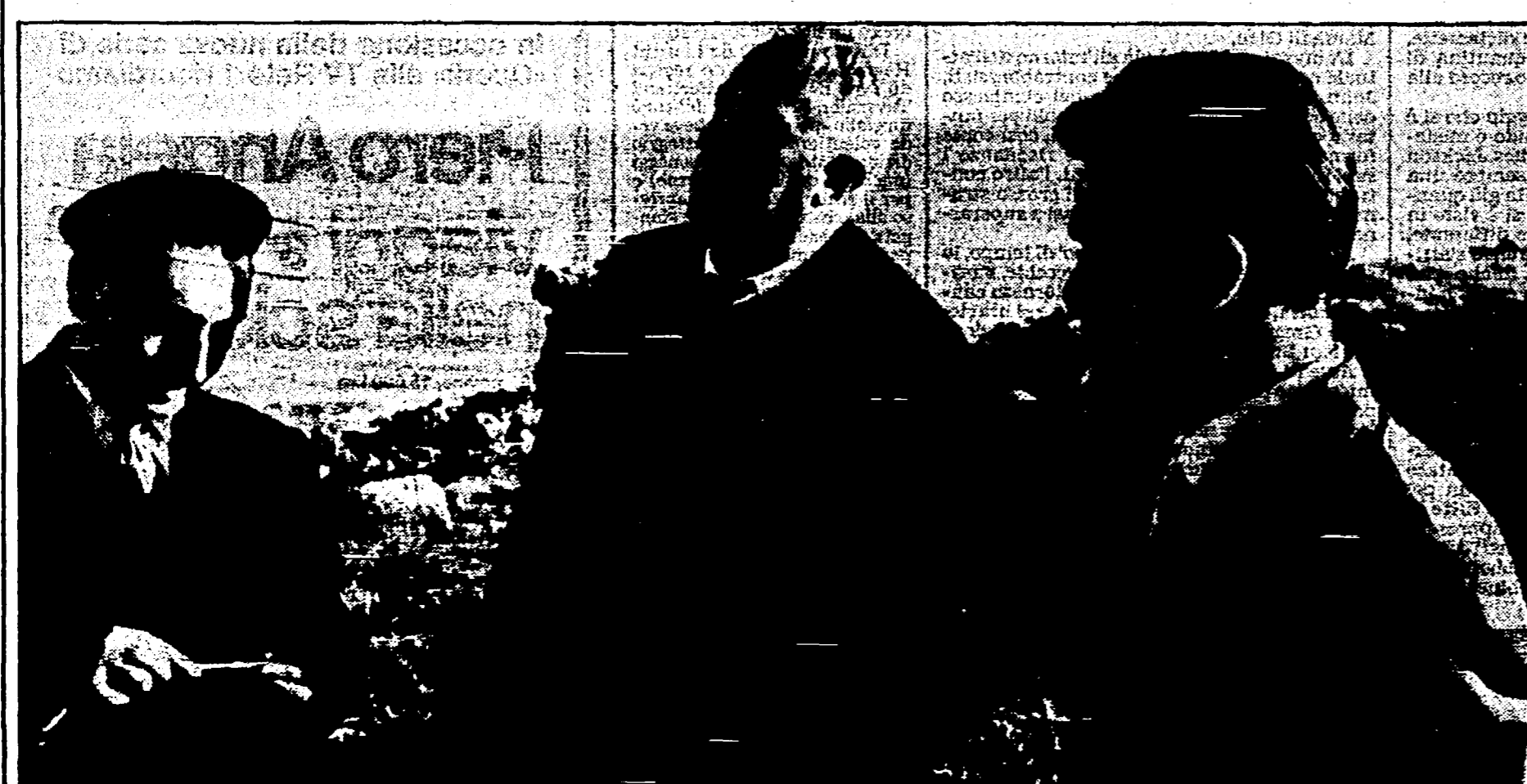
Carlo Emilio Gadda fra Vitaliano Brancati e Pier Paolo Pasolini. Sotto una foto dello scrittore lombardo

Nel '24 Gadda torna dall'Argentina e comincia a scrivere «Racconto italiano di ignoto del Novecento»: ne vengono fuori solo delle riflessioni sparse. Ma molto importanti