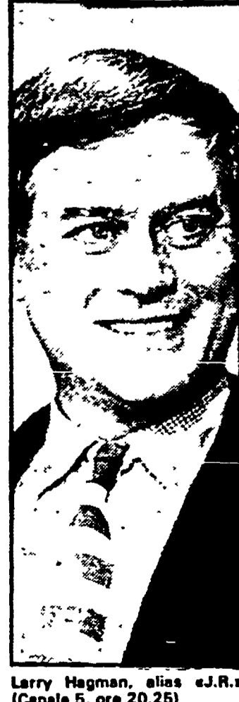
Larry Hagman, alias «J.R.» (Canale 5, ore 20.25)