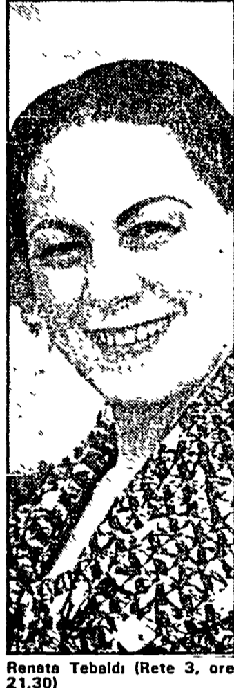
Renata Tebaldi (Rete 3, ore 21.30)