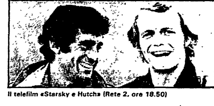
Il telefilm «Starky e Hutch» (Rete 2, ore 18,50)

Italia 1 8.30 «L'avventura di Superman»; 9.15 «Gli emigranti», telefilm; 10.05 «L'arciera del tea film di Richard Thorpe, con Robert Taylor; 12.00 «Phyllis»; telefilm; 13.00 «Ritorno a scuola», varietà; «La battaglia dei pianeti»; «Piccole donne», cartoni animati; 14.00 «Adolescenza inquieta»; telefilm; 14.45 «Amore, amore e gelosia» film di Luigi Comencini con G. Lollobrigida e M. De Sica; 16.30 «Bim bum bama», varietà; «Le avventure di Superman»; «Pelme story»; «Belle e Sebastiano», cartoni animati; 18 «La casa nella prateria»; telefilm; 19 «L'uomo da sei milioni di dollari»; telefilm; 20.00 «Lady Oscar»; 20.30 Film «Malizia»; di Salvatore Samperi, con Laura Antonelli; 22.15 Concerto della Filarmonica del Teatro alla Scala. Dirige Claudio Abbado (solo Lombard); 22.15 Telemis «Pattuglia del deserto»; 0.15 Telemis «Don August»; 1.10 Telemis «Rawhide».