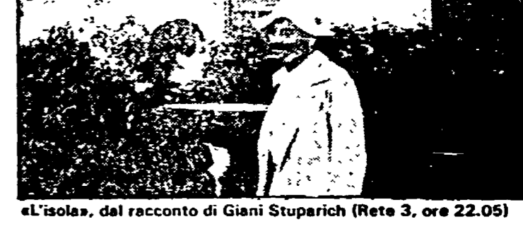
«L'isola», del racconto di Gianni Stuparich (Rete 3, ore 22,05)

Italia 1 8.30 «In casa Lawrence», telefilm; 9.20 «Angeli volanti», telefilm; 10.05 Film «L'Alba dell'ultima ora»; di Joseph Losey, con Michael Redgrave, Ann Todd; 12 Pugiato; 13 «Ritorno da scuola», varietà; «Piccole donne», cartoni animati; 14 «Adolescenza inquieta»; telefilm; 15 «Anni verdi», telefilm; 15.05 «Tante bruciate», telefilm; 16.00 Cantamelo; 17.20 «Nemico pubblico» film di William A. Wellman, con James Cagney, Jean Harlow; 22 «Quattrocento», telefilm; 22.30 «Un individuo sospetto», sceneggiato.