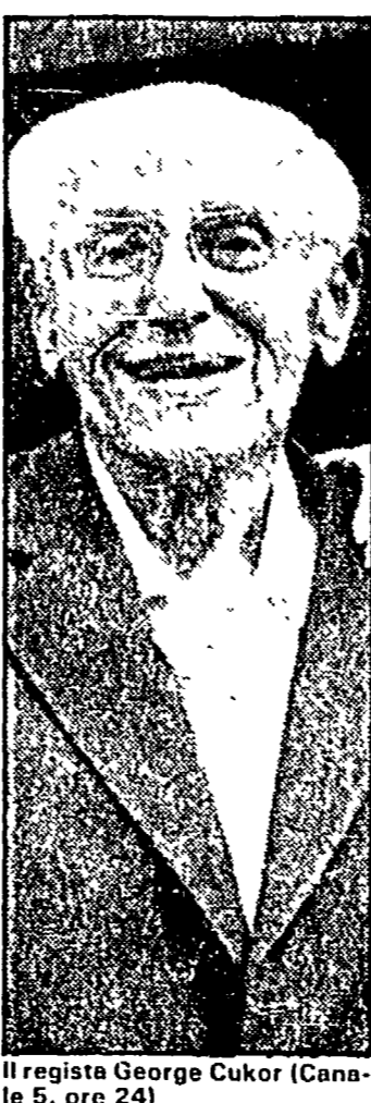
Il regista George Cukor (Canale 5, ore 24)

21.20 APPUNTAMENTO AL CINEMA 21.20 DIRM - Spettacolo musicale con Franco Franchi - Ciccio Ingrassia 22.30 TG2 - STASERA 22.40 TG2 - SPORTSETTE - Appuntamento del giovedì: Hockey su ghiaccio