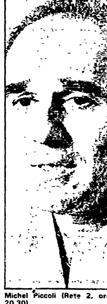
Michel Piccoli (Rete 2, ore 20,30)