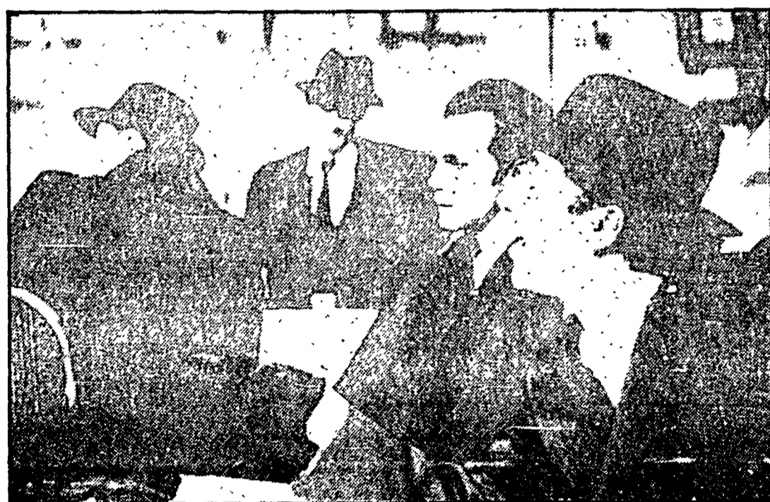
Una scena del «Mercante di Venezia» allestito a Torino dalla Compagnia di Glasgow

THE MERCHANT OF VENICE (Il Mercante di Venezia) di William Shakespeare. Compagnia del Citizen's Theatre di Glasgow.