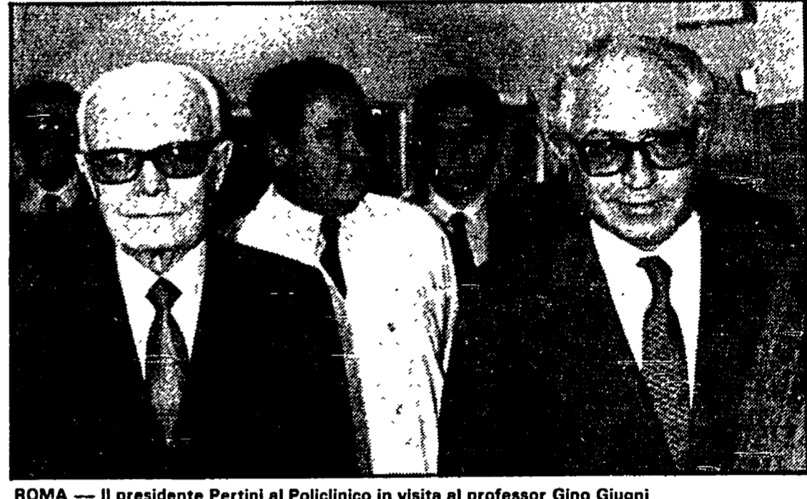
ROMA — Il presidente Pertini al Policlinico in visita al professor Gino Giugni