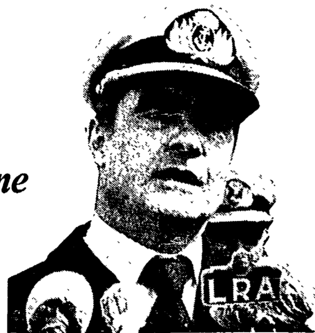
Emilio Massera, comandante della marina argentina nel periodo della più dura repressione: in basso una via di Buenos Aires: per chi protesta c'è il cellulare