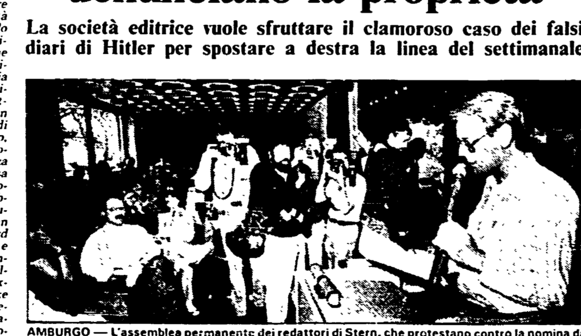
AMBURGO — L'assemblea permanente dei redattori di Stern, che protestano contro la nomina da parte della proprietà di due nuovi direttori di tendenze troppo conservatrici

Dopo la nomina dei due nuovi direttori La società editrice vuole sfruttare il clamoroso caso dei falsi diari di Hitler per spostare a destra la linea del settimanale