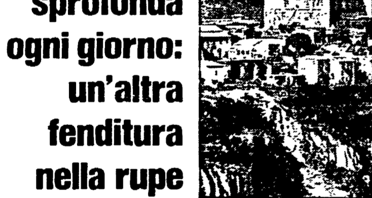
Una panoramica di Orvieto