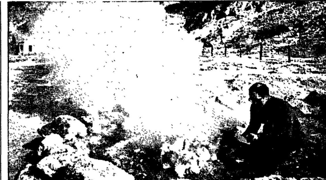
Pozzuoli — Un ricercatore controlla la temperatura di una fumarola della solfataria palermitana