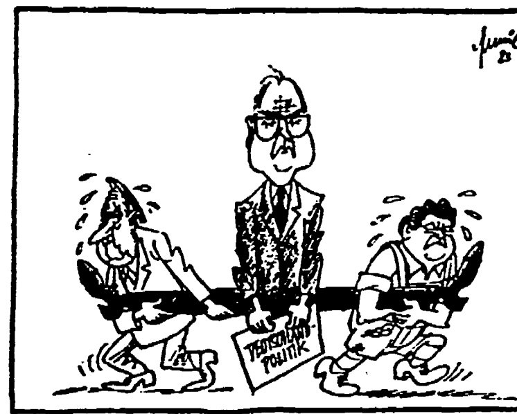
Nella vignetta (tratta dalla «Frankfurter Rundschau»): Genscher e Strauss tentano di tirare ciascuno dalla propria parte la politica intertedesca di Kohl

Nuove divisioni dopo i contrasti sulle scelte internazionali - La CSU vuole assicurarsi il controllo dei servizi di sicurezza