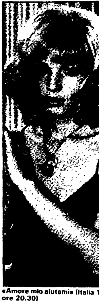
«Amore mio aiutami» (Italia 1, ore 20.30)