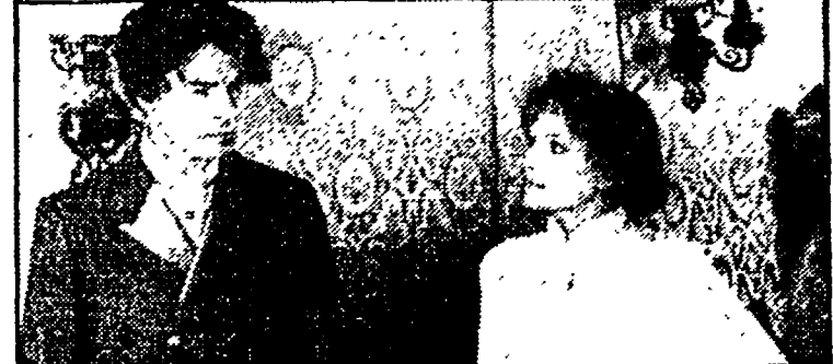
«La freccia nel fianco» (Rete 1, ore 20.30)