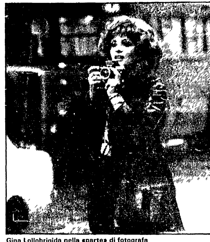
Gina Lollobrigida nella spartea di fotografia

Gina Lollobrigida ha rischiato di veder scomparire il suo «tesoro» di coppe, medaglie, targhe d'oro e d'argento che tre ladri hanno tentato di rubare la scorsa notte dalla sua villa sull'Appia antica.