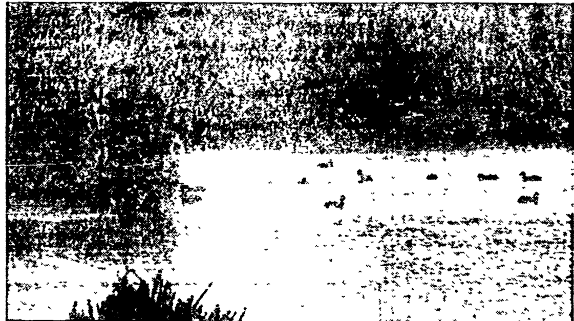
Un'immagine dell'oasi naturalistica di Nazzano

A circa quaranta chilometri da Roma, nella porzione di valle dominata dalle antiche rocce di Nazzano e di Torrita Tiberina, il Tevere riceve le acque del torrente Farfa formando nel punto di confluenza un'ansa di rara bellezza.