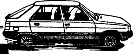
Renault 11, 1100-1400 cc