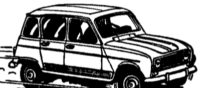
Renault 4, 850-1100 cc