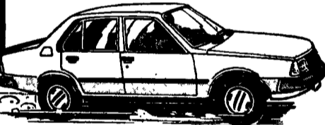
Renault 18, 1400-1600 cc-Diesel-Turbo