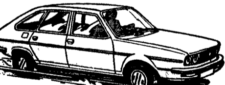
Renault 30, 2600 cc-TurboDiesel