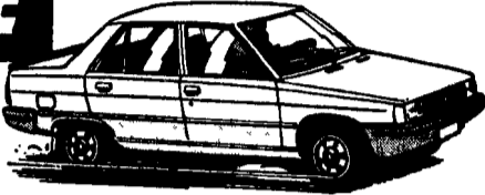
Renault 9, 1100-1400-Diesel 1600 cc