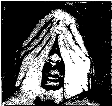
RIPOLI DEL LIBANO - Affaticato per le lunghe giornate di tensione, Arafat si è spesso coperto gli occhi durante una conferenza stampa a Tripoli del Libano alla vigilia della sua partenza per Damasco.

perpetrare un nuovo massacro contro il popolo palestinese, massacro che porterebbe a termine quello che gli israeliani non hanno completato nell'assedio di Beirut.