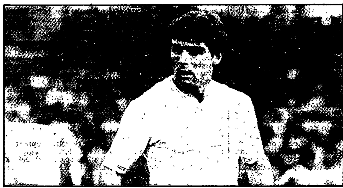
VINAZZANI è stato acquistato dalla Lazio

giro di giocatori che vede coinvolto anche l'Udinese. Risultato dovrebbe essere: Wierchowod e Gerolin in bianconero, Gentile, Tardelli e Mauro a Genova e Casagrande più Pellegrini quello della Samp a Udine. Sarà vero? Su questa notizia qualcuno ha scommesso anche la seconda casa.