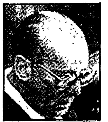
Joao Baptista Figueredo

Tesoro e dalle imprese statunitensi, producono per questa ripresa. La locomotiva americana è rignita sola, lasciando i vagoni europei dietro di sé.