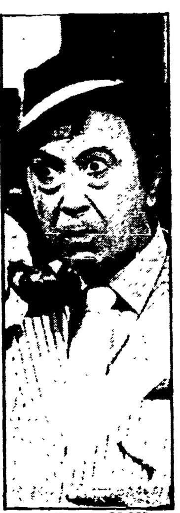
Macario (Rete 1 - 20.30)