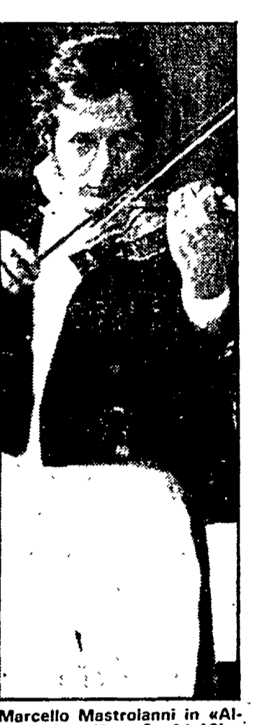
Marcello Mastroianni in «AllonDIANO» (Rete 2 - 14.10)