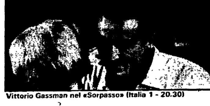
Vittorio Gassman nel «Sorpasso» (Italia 1 - 20.30)