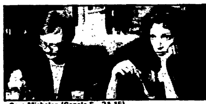
«Caro Michele» (Canale 5 - 21.15)