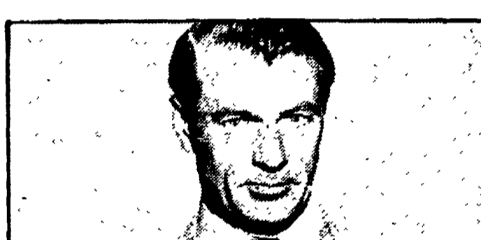
Gary Cooper (Italia 1 - 10.15)