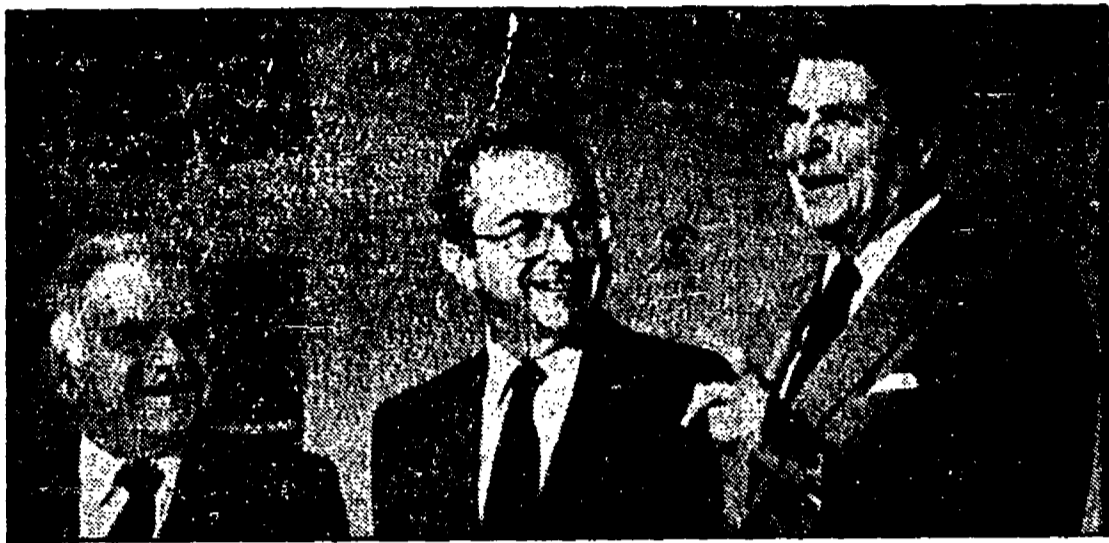
WASHINGTON — Il presidente Reagan e i ministri israeliani degli Esteri e della Difesa (da sinistra) Shamir e Arens durante l'incontro con la stampa