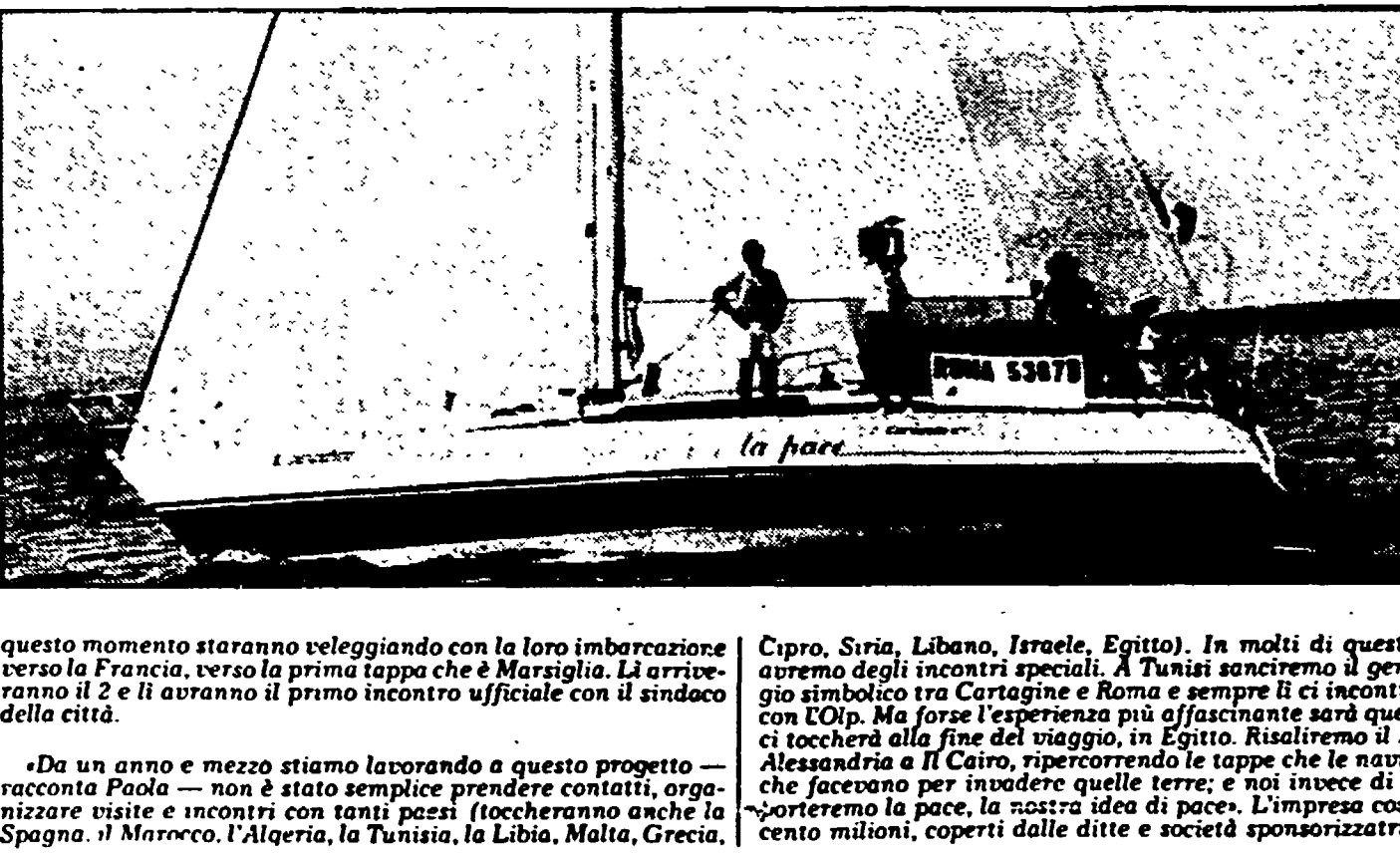
questo momento stanno veleggiando con la loro imbarcazione verso la Francia, verso la prima tappa che è Marsiglia. Lì arriveranno il 2 e lì avranno il primo incontro ufficiale con il sindaco della città...»