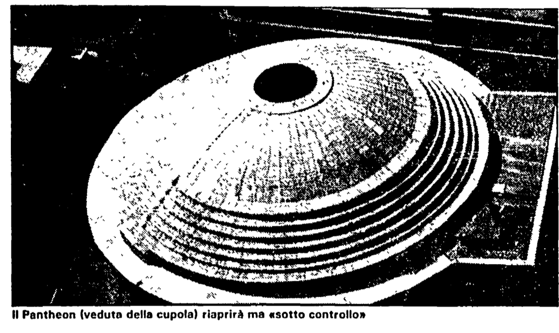
Il Pantheon (veduta della cupola) riaprirà ma sotto controllo

Il Pantheon riapre. La gemma di Roma chiusa al pubblico da più di quattro mesi torna da sabato prossimo alla città e ai suoi turisti. La decisione è stata presa dal sovrintendente ai beni ambientali, Giovanni Di Geso.