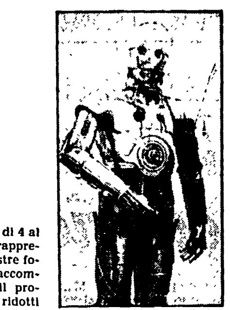
Un robot di «Guerra stellaria»

Spostatosi dalla fine di luglio sul lido di Castelporziano, ad Ostia, il cinema estivo di «Little Italy '83» prosegue con successo la presentazione di circa 150 pellicole proiettate tra il 1 e il 2 cancello. La manifestazione vuole evidenziare l'apporto «made in Italy» nella cinematografia americana: numerosi