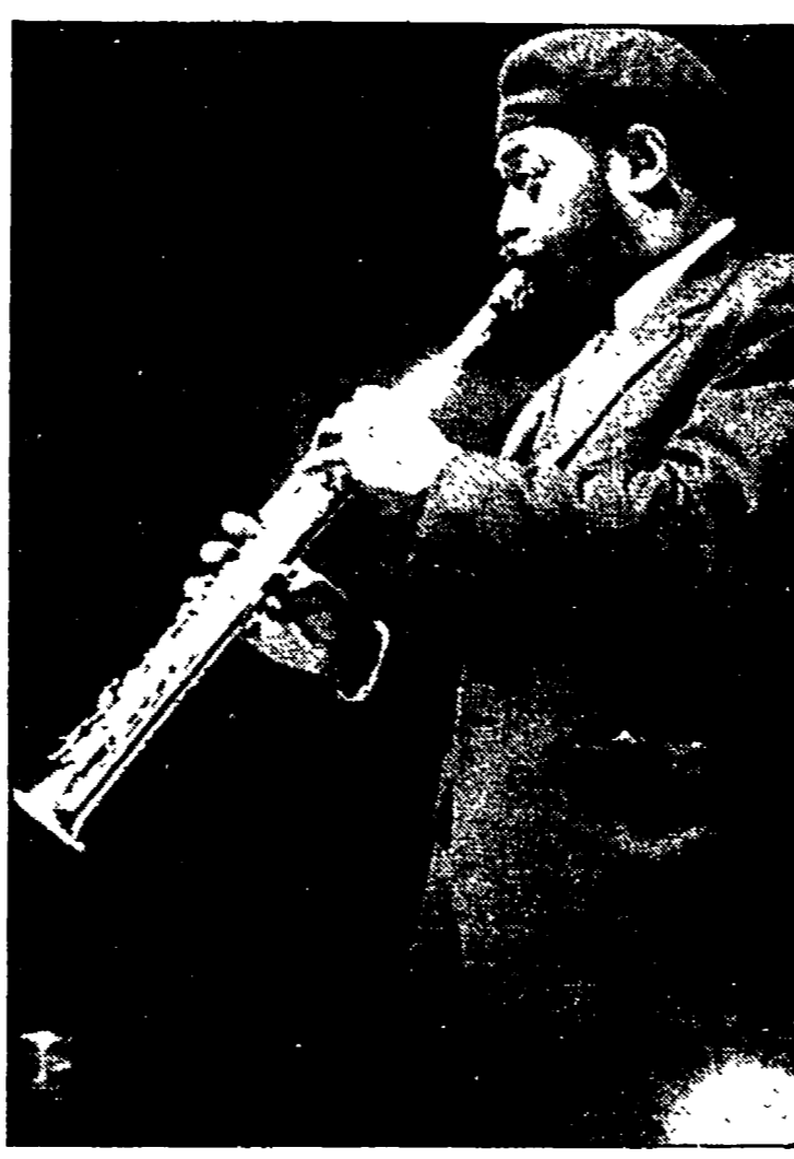
Archie Shepp e, in alto, Cecil Taylor

na, giunto alla sua sesta edizione, può considerarsi ormai la più consolidata rassegna jazzistica del Meridione. Rispetto agli scorsi anni presenta la novità di un concerto per giovani musicisti, che si terrà parallelamente al festival, ma ha rinunciato all'impostazione tematica che l'aveva caratterizzato fin dall'inizio. Il cartellone varato dal Brass Group messinese, tradizionale promotore della rassegna, annuncia comunque diverse proposte di notevole interesse, distribuite attorno ai due maître di pensiero della generazione del free jazz Cecil Taylor e Archie Shepp, che sono indubbiamente i nomi di maggiore spicco. Si apre il 2 settembre con il quartetto del pianista inglese Martin Joseph, cui faranno seguito la cantante Rosay, rivelazione dell'ultimo festival di Montreux, e la straordinaria Cecil Taylor Unit, comprendente il fedelissimo sassofonista Jimmy Lyons. Nella serata successiva, ci saranno la giovane vocalist Tiziana Ghiglioni, eccezionalmente accompagnata dal pianista Kenny Drew, lo Jonian Colours Quintet e il chitarrista statunitense Ray Vaughan.