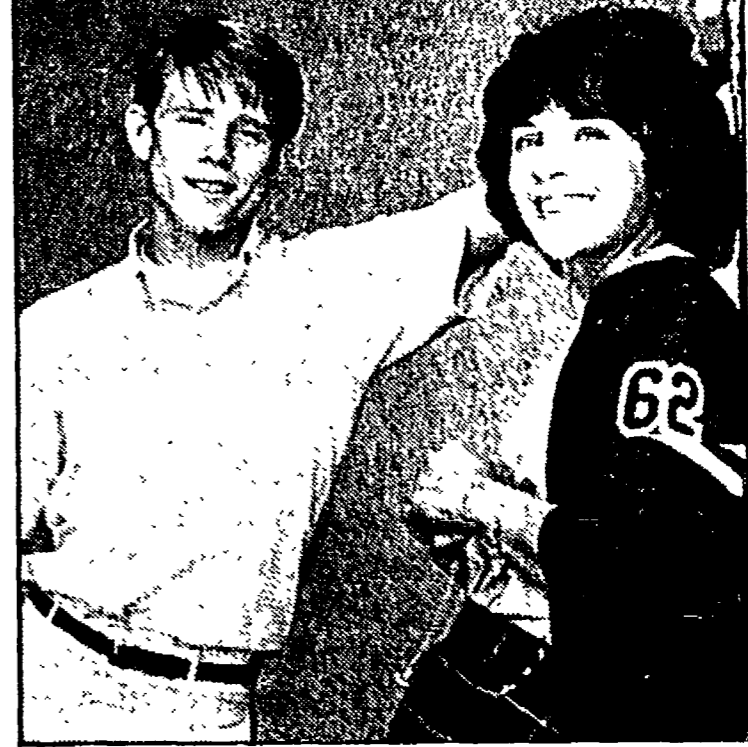
Un'inquadratura da «American Graffiti» il film scaposo di Lucas sui teen-agers americani