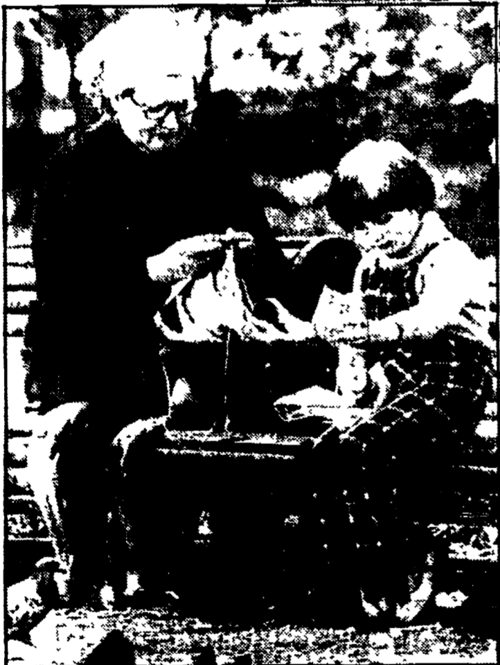
Nonne e nipote in un parco di Mosca. In alto, uno scorcio della Piazza Rossa