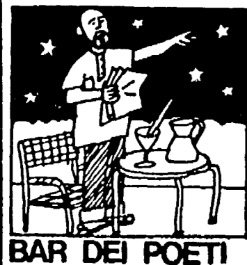
BAR DEI POETI