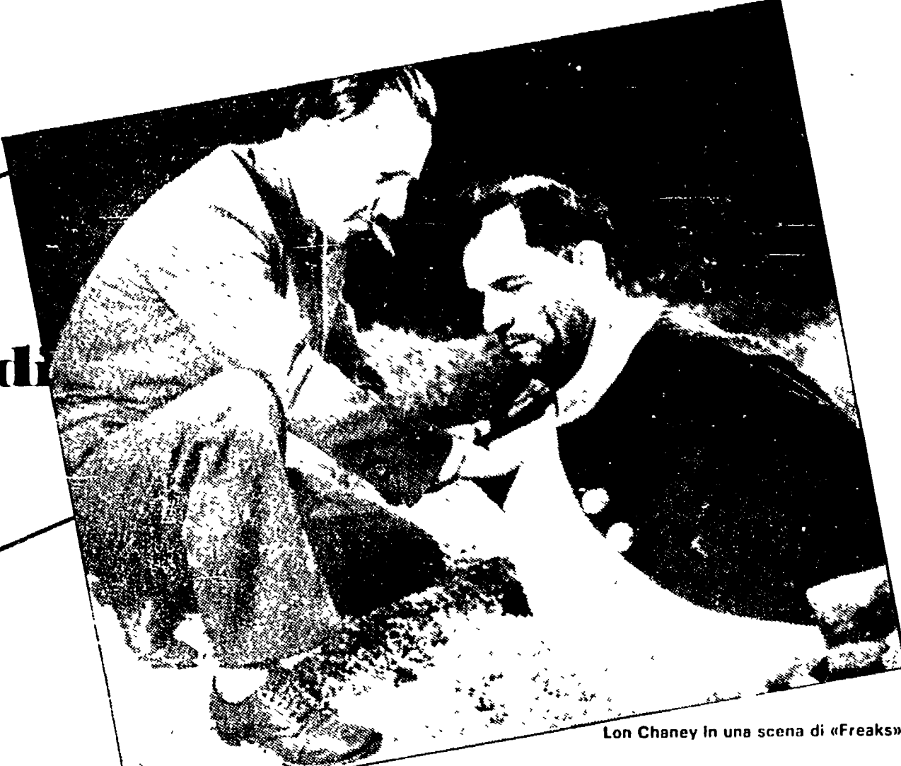
Lon Chaney in una scena di «Freaks»