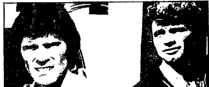
«Codice Ru» su Retequattro, ore 15.45