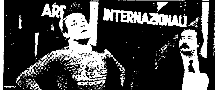
«Un sacco Verdona» (Telemontecarlo, 20.30)