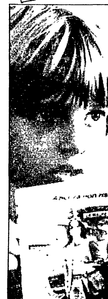
«Giovanni da una madre all'altra» (Rete 1, ore 20.30)