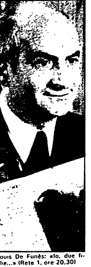
Louis De Funès: «Io, due figlie...» (Rete 1, ore 20.30)