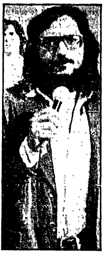
La voce del Nomadi

La passerella di grandi nomi dello spettacolo alla Festa di Villa Gordiani prosegue con «I Nomadi». Questa sera alle 21 si esibiscono in un concerto (prezzo del biglietto di ingresso duemila lire). Alle 22 nell'area del cinema si proietta «Una moglie» di John Cassavetes con Jill Clayburgh. Sempre alle 22 entrano in funzione la discoteca e il piano bar.