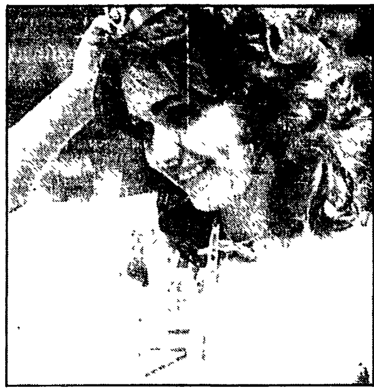
La prima miss danubiana