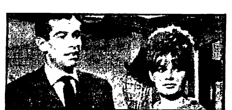
Brigitte Bardot: «Piace a troppia» (Rete 1, ore 20,30)