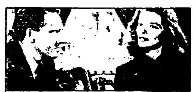
«Prigioniera di un segreto» (Rete 3, ore 21,55)