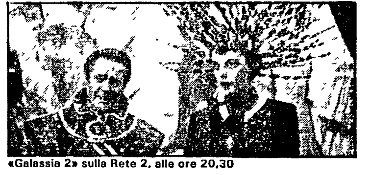
«Galassia 2» sulla Rete 2, alle ore 20,30