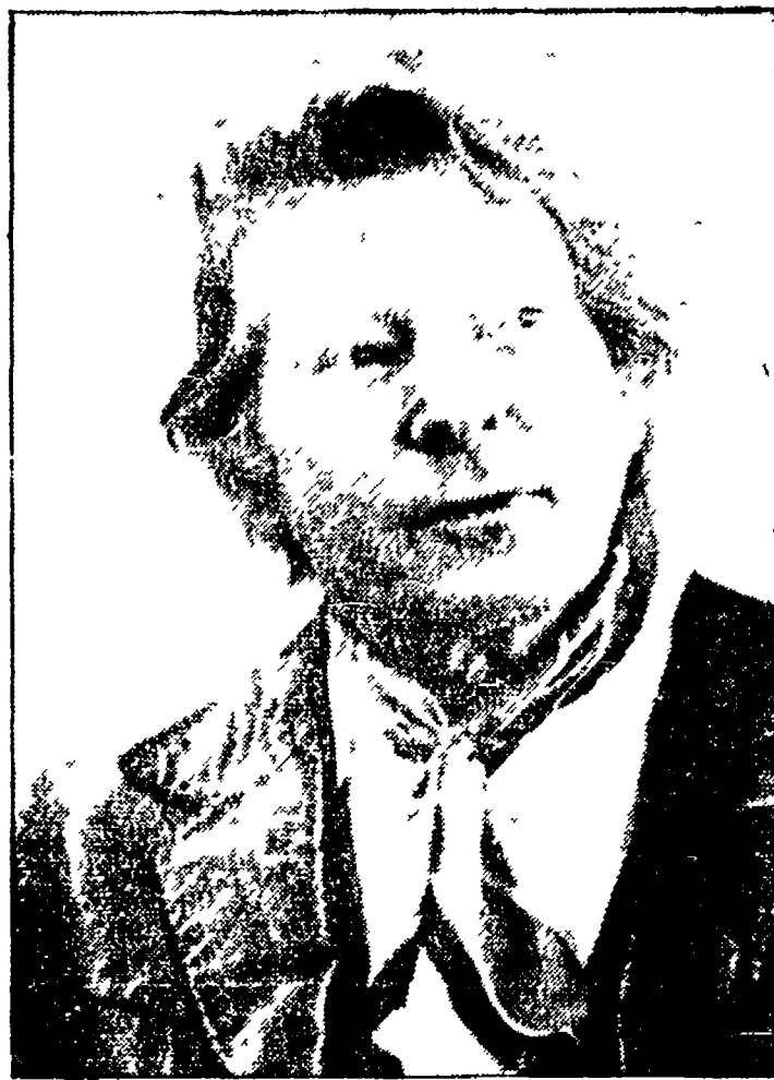
Danny Kaye e, a destra una scena di «Diritto di offesa»