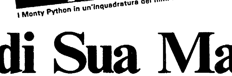
1 Monty Python in un'inquadratura del film. A sinistra Terry Jones