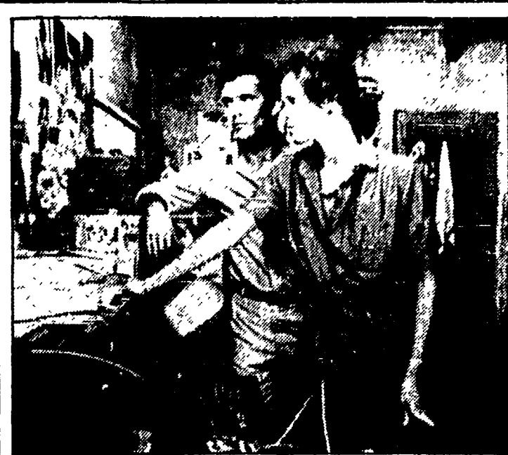
Mel Gibson e Sigourney Weaver in una scena del film