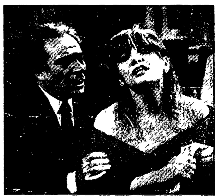
Ugo Tognazzi e Piera degli Esposti in «Scherzo»