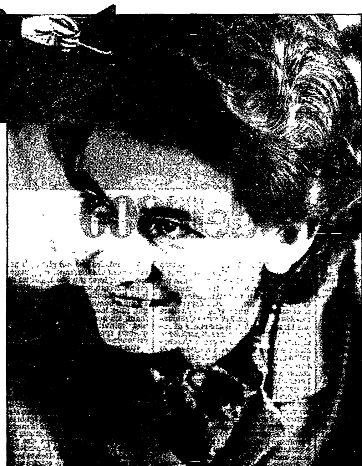
Christa Wolf e in alto Cassandra in una miniatura da un codice francese delle «Donne illustri» del Boccaccio, del secolo XV