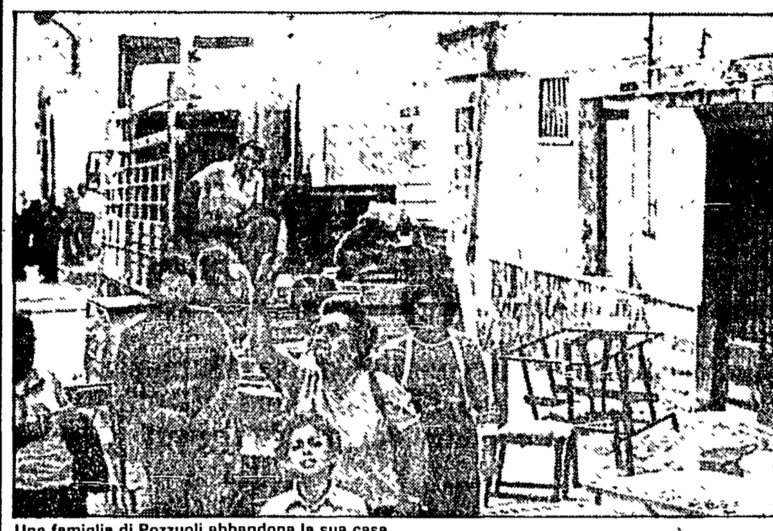
Una famiglia di Pozzuoli abbandona la sua casa

LATINA - Le prime famiglie di terremotati provenienti da Pozzuoli sono arrivate ieri nel sud della provincia di Latina. Sono le uniche fornite, per ora, di una autorizzazione ufficiale del ministero.