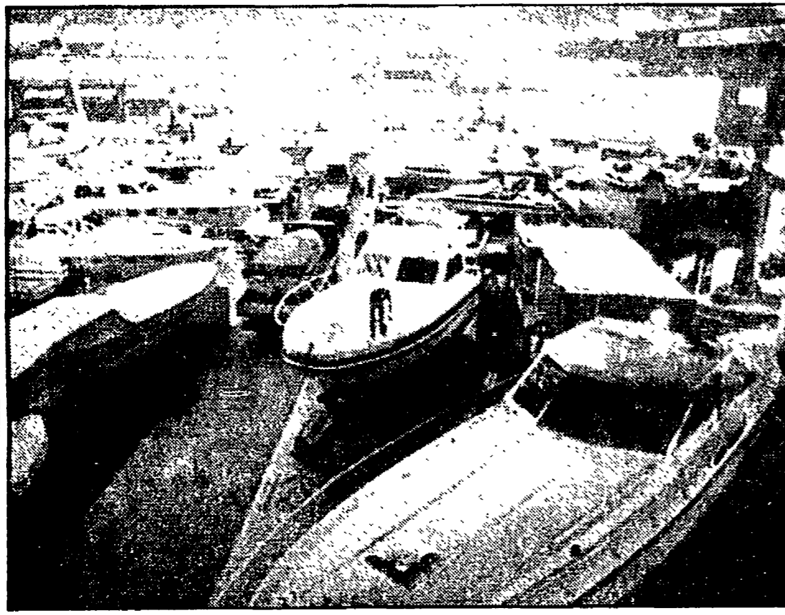
GENOVA - Ultimi preparativi al Salone della nautica che aprirà i battenti questa mattina

La produzione calata dell'8,2% - Per le tavole a vela crollo del 21% I prezzi aumentano - Migliaia di portuali e di cantieristi manifestano stamane alla Fiera del Mare per protestare con il governo