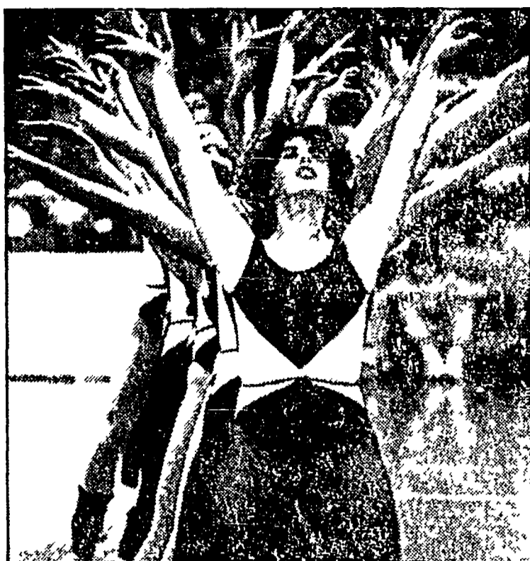
È il grande momento della ginnastica aerobica, salutare esercizio a suon di musica. Tutte le occasioni sono buone per i promotori di questa attività, venuta dagli Stati Uniti, per mostrare un'esibizione. Così domenica sera gli appassionati di pallacanestro hanno potuto vedere questa scena nell'intervallo di Banca Roma-Scavolini.