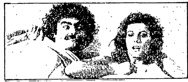
«Eccellente veramente» (Italia 1, ore 20.30)