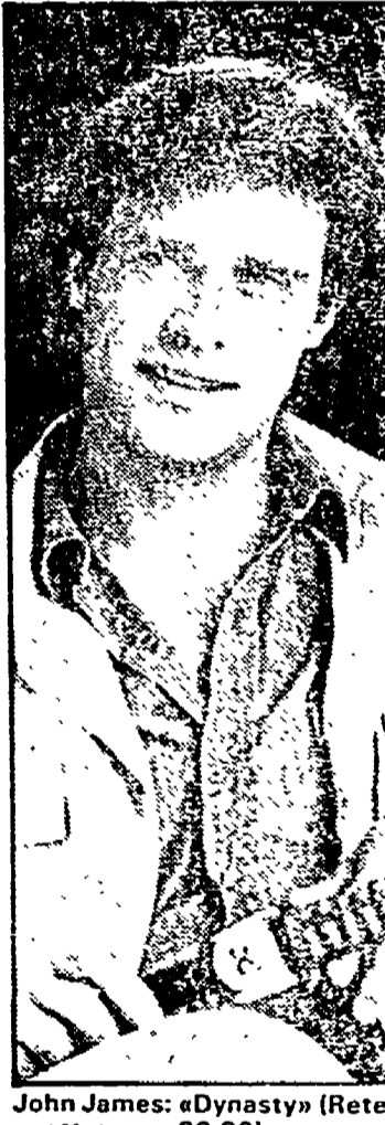
John James: «Dynasty» (Retequattro, ore 20.30)