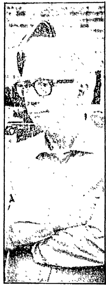
Bigli: cura gli speciali di Rete quattro (ore 22.30)

Raiuno 12.00 TG1 - FLASH 12.05 PRONTO, RAFFAELLA? - Con R. Carrà 13.25 CHE TEMPO FA 13.30 TELEGIORNALE 14.05 SULLE STRADE DELLA CALIFORNIA - Telefilm 15.00 CRONACHE ITALIANE - CRONACHE DEI MOTORI 15.30 DSE: L'ALTA MODA IN ITALIA DAL 1940 AL 1980 - Di Bonizza Giordani Aragno 16.00 MARCO - Cartone animato 16.50 OGGI AL PARLAMENTO 17.00 TG 1 - FLASH 17.05 IN TOURNEE - «Nada in concerto» 18.00 TUTTILIBRI - Settimanale di informazione libraria 18.30 TAXI - «Non dire chi sei», telefilm 19.00 ITALIA SERA - Fatti, persone e personaggi 19.45 ALMANACCO DEL GIORNO DOPO - CHE TEMPO FA 20.00 TELEGIORNALE 20.30 UNA GIORNATA PARTICOLARE - Film di Ettore Scola, con Sophia Loren, Marcello Mastroianni (1° tempo) 21.50 TELEGIORNALE 21.55 UNA GIORNATA PARTICOLARE - Film (2° tempo) 22.25 DOSSIER SUL FILM «UNA GIORNATA PARTICOLARE» - In studio Beniamino Placido 23.40 TG1 NOTTE - OGGI AL PARLAMENTO - CHE TEMPO FA Raidue 12.00 CHE FAI MANGI? - Regia di Leone Mancini 13.00 TG2 - ORE TREDICI 13.30 CAPITOL - Di Stephen e Elinor Karpf 14.15 TANDEM... IN PARTENZA - Notizie, curiosità, sommario 14.30 TG2 - FLASH 14.35-16.30 TANDEM - «Tre lettere per...» - «La Pimpa», cartoni animati di Altan 16.00 COPPE EUROPEE DI CALCIO - Sintesi delle partite 16.30 DSE: EDUCAZIONE ALLO SVILUPPO - Gli sprechi e la fame nel mondo 17.00 RHODA - «L'ospite in più», telefilm 17.30 TG2 - FLASH 17.35 DAL PARLAMENTO 17.40 VEDIAMOCI SUL DUE - Cronaca, quiz, libri, cinema, teatro 18.30 TG2 - SPORTSERA