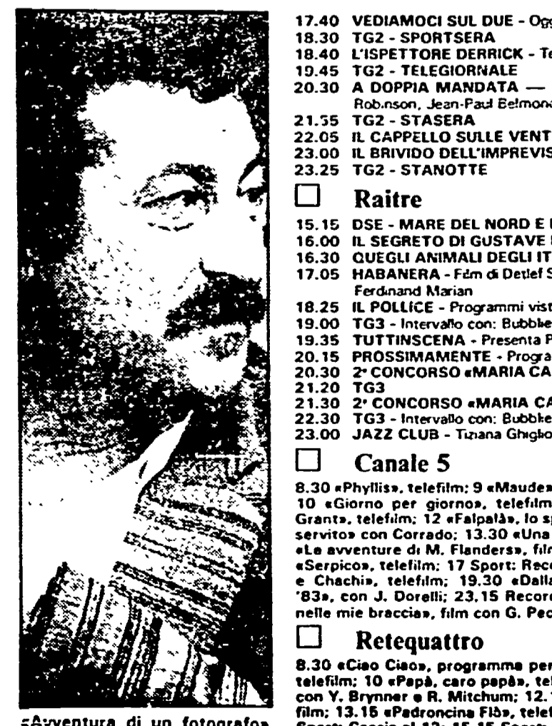
«Avventura di un fotografo» (Raidue, ore 18.40)