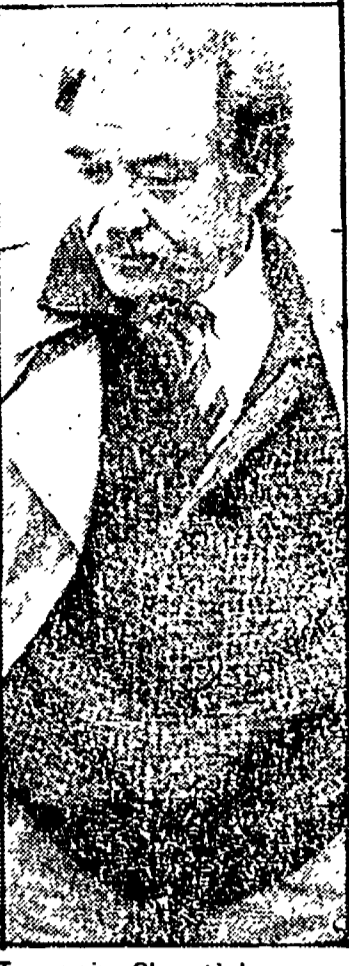
Tognazzi: «Che età la mezza età» (Raitre, ore 22.55)