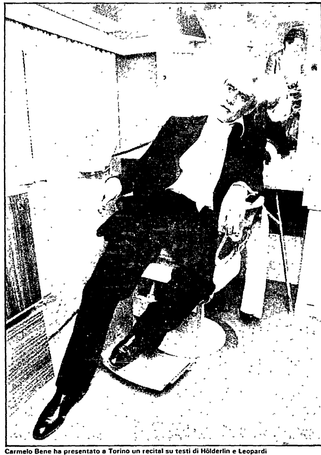
Carmelo Bene ha presentato a Torino un recital su testi di Hölderlin e Leopardi