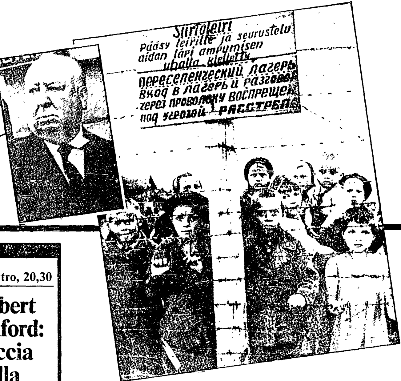
Bambini sovietici in un campo di concentramento nazista. In alto Alfred Hitchcock