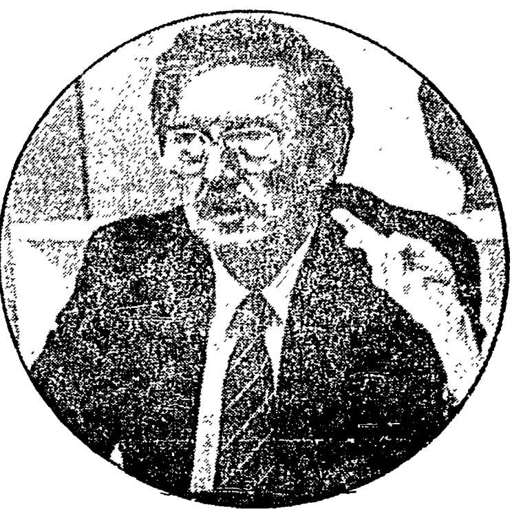
Pierre Culifford, il «Peyo» che ha inventato i celebri puffi