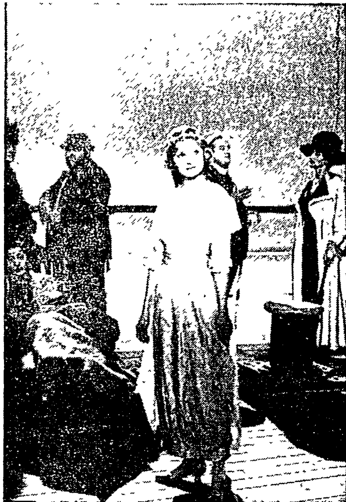
Un'inquadratura da «L'Inquadratura» di Fellini

Cinema chiuso, domenica prossima, in tutta Italia. La Federazione lavoratori dello spettacolo e dell'informazione CGIL, CISL, UIL ha infatti indetto uno sciopero di 24 ore in tutte le sale cinematografiche per l'8 gennaio. La decisione è stata presa a conclusione dell'ultimo incontro dei sindacati con i rappresentanti dell'ANEC, l'associazione esercenti cinematografici, nel corso della trattativa per il rinnovo del contratto. I motivi dello sciopero — è detto in un comunicato della controparte di offrire risposte concrete alle richieste avanzate. La delegazione dell'ANEC-AGIS al di là delle profferite di confronto, ha respinto i punti più qualificanti della piattaforma rivendicativa trincerandosi dietro lo stato di crisi del settore. Si tratta di un tentativo di mettere in discussione la possibilità di estendere ai lavoratori del servizio cinematografico i termini delle intese interconfederali già riconosciute e applicate per tutte le altre categorie del mondo del lavoro.