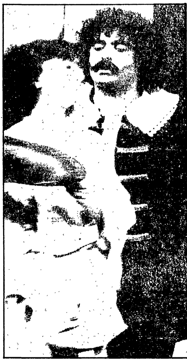
Diego Abatantuono nei panni di Sganarello nel «Don Giovanni»

PARIGI — Nuova parte di cattivo per l'attore tedesco Klaus Kinski, questa volta in un «re-make» firmato da Roger Vadim del dramma di Jean Cocteau «La bella e la bestia». Coprotagonista sarà l'attrice americana Susan Sarendon («Atlantic City» e «Fretty baby», tra gli altri). In seguito Kinski interpreterà «The little drummer girl» un adattamento cinematografico di George Roy Hill dell'opera di John Le Carré, lo scrittore inglese autore di celebri romanzi («La spia che venne dal freddo».