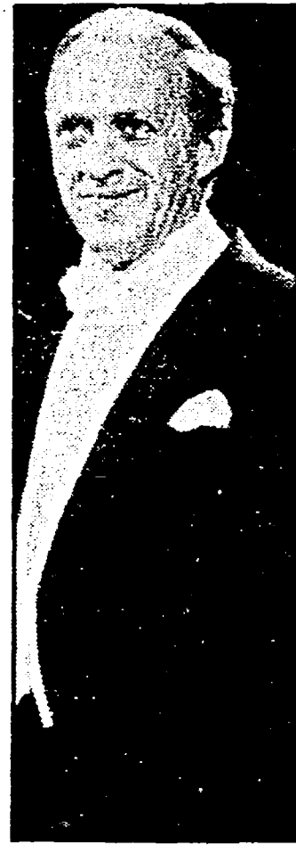
Raimondo Vianello presenta «Zig Zag»