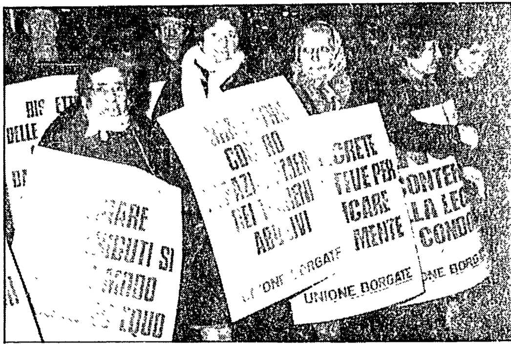
Una manifestazione contro il condono dell'Unione Borgate

«Questo condono è iniquo» - Salvare la legge regionale Oggi assemblee PCI