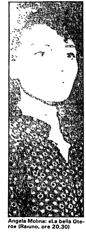
Angela Molina: «La bella Otero» (Raiuno, ore 20,30)