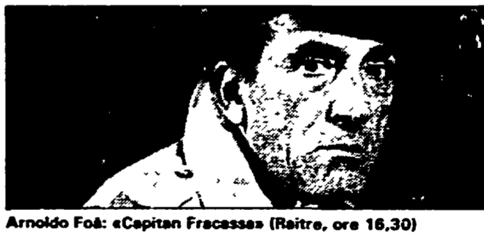
Arnoldo Foà: «Capitan Fracassa» (Raitre, ore 18,30)