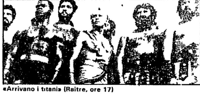
«Arrivano i titani» (Raitre, ore 17)