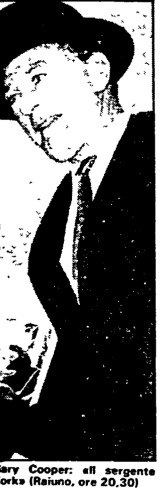
Gary Cooper: «Il sergente York» (Raiuno, ore 20,30)