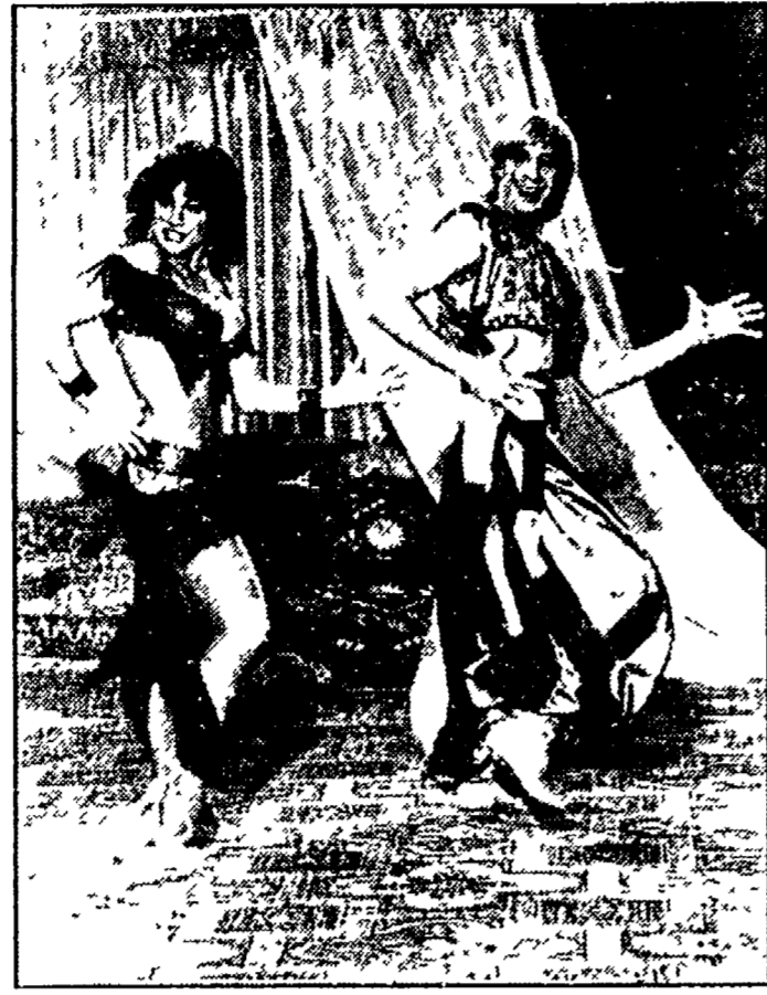
Carmen Russo e Enzo Paolo Turchi al «Drive in»