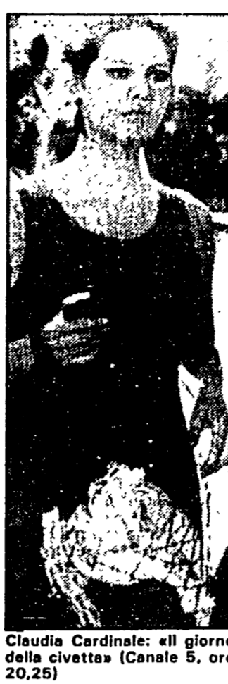
Claudia Cardinale: «Il giorno della civetta» (Canale 5, ore 20,25)