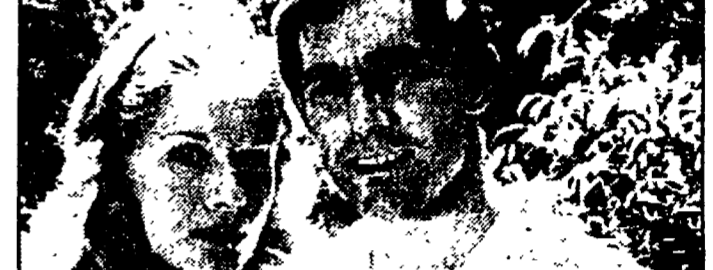
«Il giardino dei Finzi Contini» (Retequattro, ore 20,25)