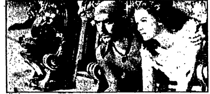
«Il cigno nero» su Raitre alle 20,30