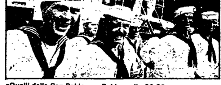
«Quelli della San Pablo» su Raidue, alle 20,30