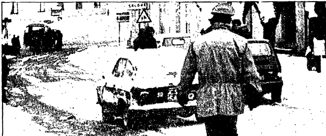
A FIANCO: difficoltà nel corso di Cosenza a causa delle abbondanti nevicate nevicate ACCANTO AL TICINO: barriere d'emergenza per fronteggiare la violenza della neve sulla costa marchigiana

Ecco una delle prime immagini, scattata da bordo dello Challenger, di uno degli specialisti della missione, Bruce McCandless, mentre sta usando lo zaino a razzi che gli consente di volare liberamente attorno alla navicella.