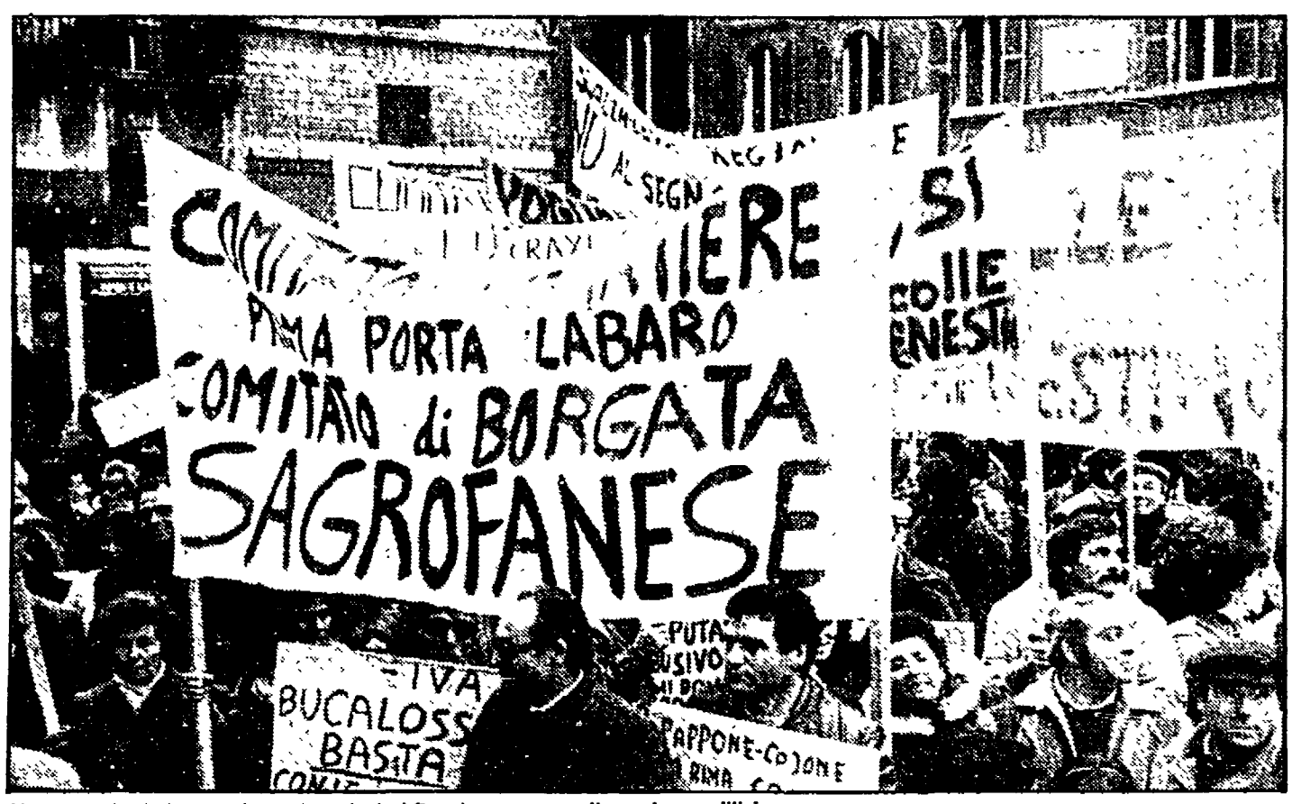
Uno scorcio della manifestazione ieri al Pantheon contro il condono edilizio