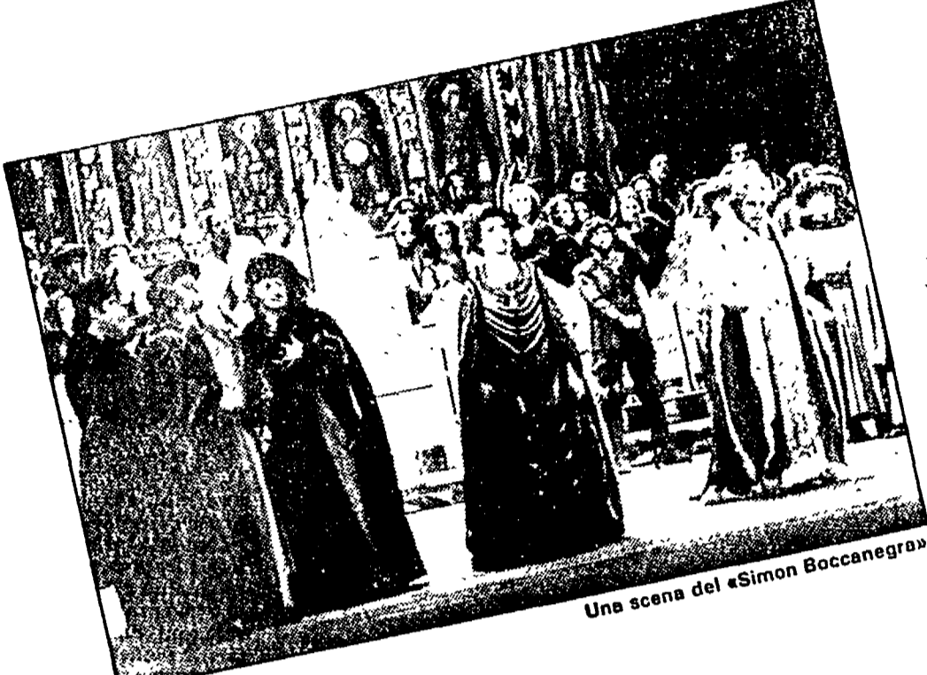
Una scena del «Simon Boccanegra»

L'opera A Bologna una versione tutta «verista» del «Simon Boccanegra» che rispetta poco la complessità del lavoro verdiano. E solo alla fine Bussotti fa trionfare la poesia