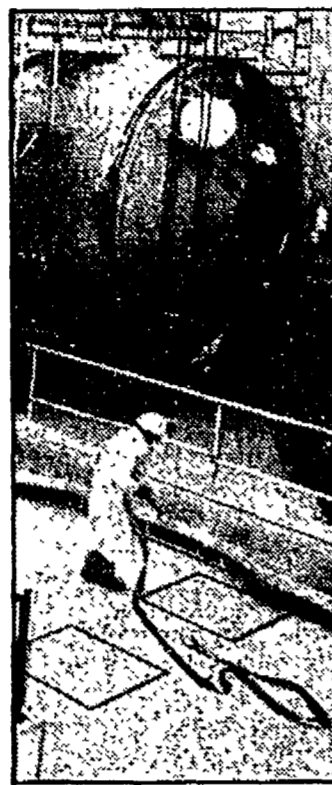
Accanto al titolo un disegno della navetta spaziale; sopra, prove strutturali sullo Space Shuttle negli stabilimenti Aeritalia

ROMA - Non è la prima volta che l'Italia collabora alla costruzione di satelliti spaziali americani... Ma l'affare più grosso deciso nel vertice romano sembra essere quello della stazione spaziale.